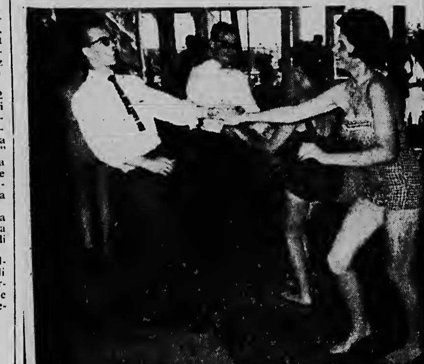
E toeristanan aki a jega di bishita Aruba caba. Nan comose e beach caba, pero nan a halla asina cu smak manera aki cu sr. Chai di Toeristenbureau. Su mensa na a puntra: pero esaki ta facil pa comprende....